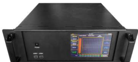
X-KEY XXL PROCESSOR