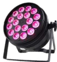
CL PAR 18H

Линзовые прожекторы серии CL сконструированы на высококачественных диодах Edison с приятным качественным оттенком тепло-белого цвета и высоким индексом CRI.