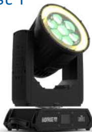
Outcast 1 BW