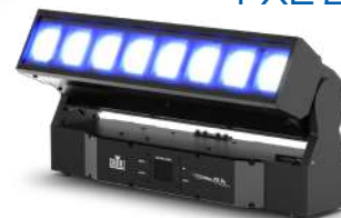
PXL BAR 8

COLORado — это традиционные осветительные приборы типа LED-PAR, LED-BAR, LED-PANEL. Они выделяются своей практичностью, яркостью и универсальностью.