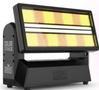
Color Strike M