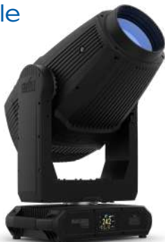
Storm 4 Profile