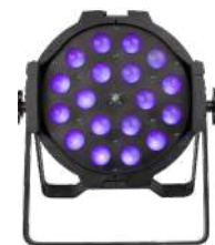
CL PAR 18HZ